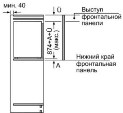
Размеры в мм